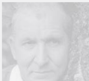
MOTRON A. HAVELKA (GERMANY)

Rückstände Kohle | Mixed Media | 40 cm x 40 cm | 2011